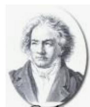
Ludwig van Beethoven